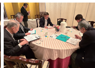
会場・親睦会・友愛部会