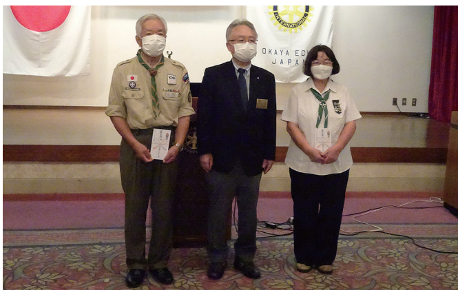
◆ボーイスカウト・ガールスカウト活動支援金授与